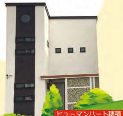
ヒューマンハート穂積

友達作りや集団の行動の練習、自分で出来ることを学ぶための「ヒューマンハート穂積」教室。そしてこの度子ども達の成長に合わせて、・進学準備・就職に向けた機能訓練などを中心とした「ヒューマンハート穂積第2」教室を開所致しました。めまぐるしく成長していく子ども達、そしてその将来のためのスキルアップをできる限り支援できる環境を充実させていきたいと考えています。